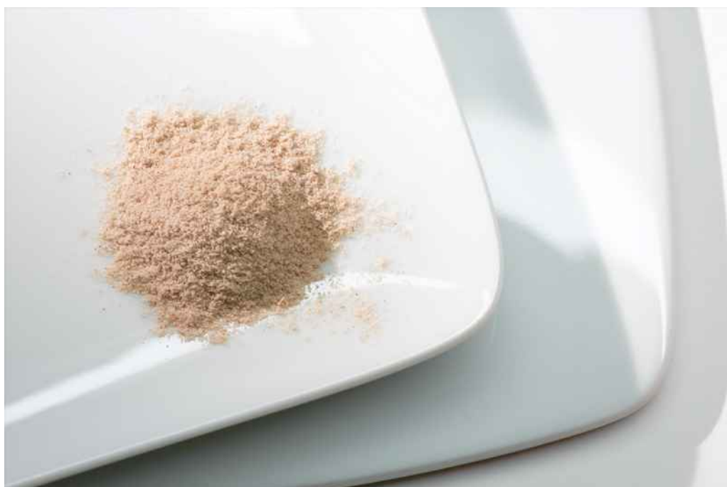
Farina di mandorla | Prunus dulcis

Un consiglio: Il Bagno di vapore per il viso e la Maschera purificante sono i prodotti indicati per una pulizia in profondità e completano il trattamento al viso quando la pelle tende a presentare impurità.